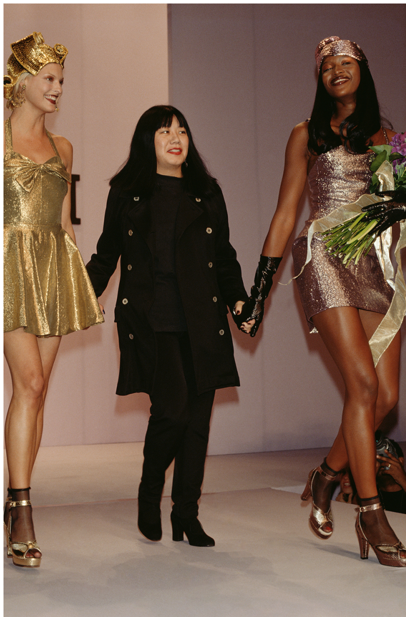
סוי עם הסופר מודלס של הניינטיז נעמי קמפבל ולינדה אוונג'ליסטה

התערוכה 'מגלים' מחדש את אופנת ניו יורק מ-1982 עד 1997' מציגה דימויים מתקופת ימי הזוהר של עולם האופנה הניו-יורקי המהירה של שנות ה-80 אפשרה לעולם האופנה להתפתח בקצב מסחרר. מעצבים החלו לעצב ביגוד יומימי באיכות גבוהה ולב אדפטציה שהתאימה אותו לקהל רחב יותר. אנשים זנחו את הג'ינס והטרנינג והחלו להעניק לאופנה מקום חשוב יותר שאינו ש במקביל הנשים אימצו את כוחה של האופנה בשביל לחזק את מעמדן במקומות העבודה כאשר הן החלו ללבוש את "חליפות ה גזרות נשיות לחליפות מחויטות של אנשי עסקים. מעצבים ודוגמניות על זכו למעמד של סלבריטאים והליכות הסיום בתצוגות א תרבותי שהמונים ציפו לו. האוסף שמוצג בתערוכה חושף רגעים צבעוניים ועליזים מתוך אותן הליכות סיום של מעצבי העל והד ביותר בשנים 1982-1997.