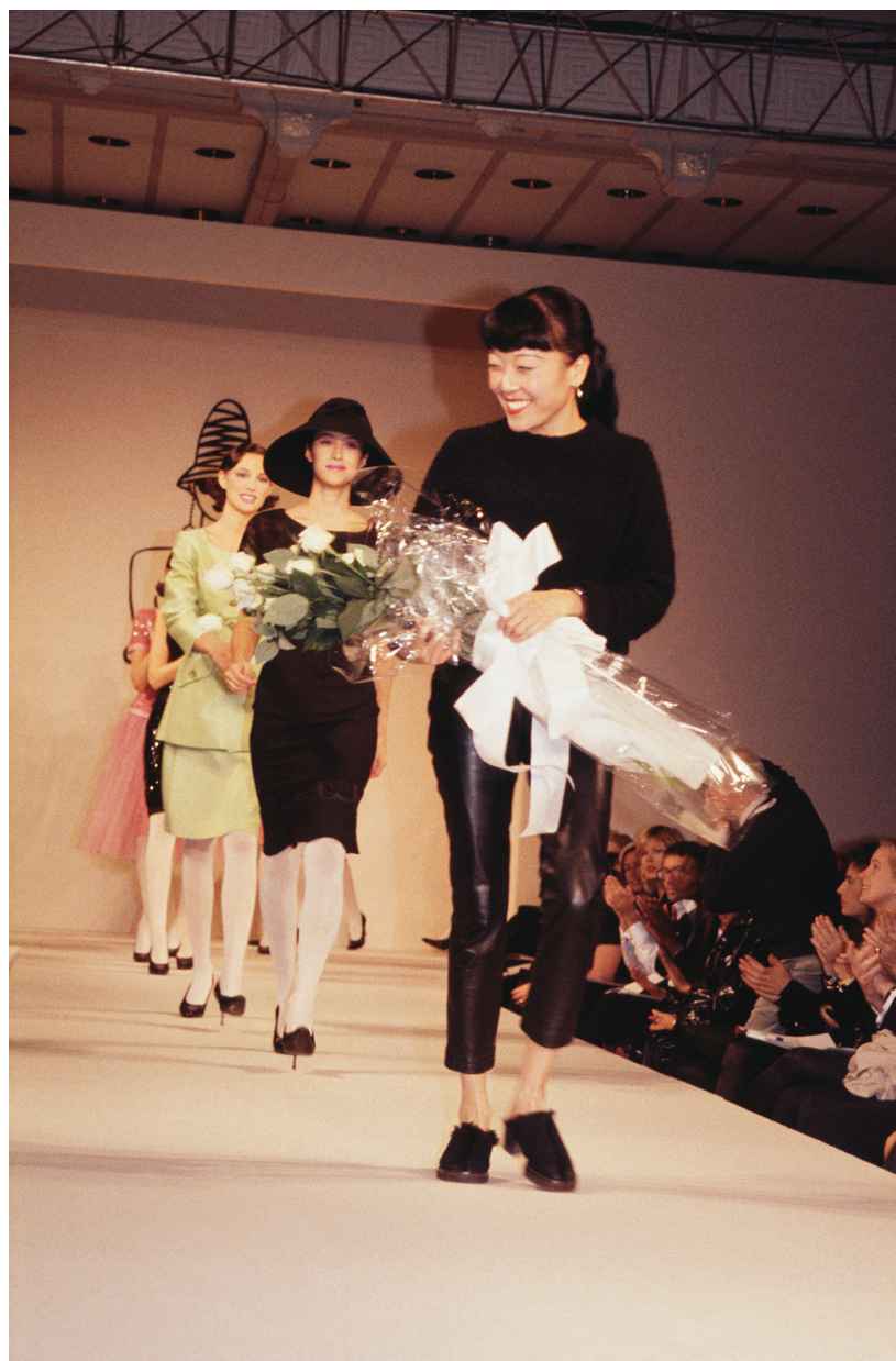
מתוך התערוכה. "מגלים מחדש את אופנת ניו יורק"

קידר איגדה אוסף יוצא דופן בתערוכה תחת השם: 'מגלים מחדש את אופנת ניו יורק מ-1982 עד 1997'. התערוכה מוצגת בלוג השוכנת בבניין טיימס סקוור 10, הידוע גם בשם ברודוויי 1441, ביתם הקודם של חלק מהמעצבים הבולטים בניו יורק באותן ש לקהל הרחב החל מה 5 בספטמבר יחד עם פתיחתו של שבוע האופנה בניו יורק ותינעל בינואר 2020.